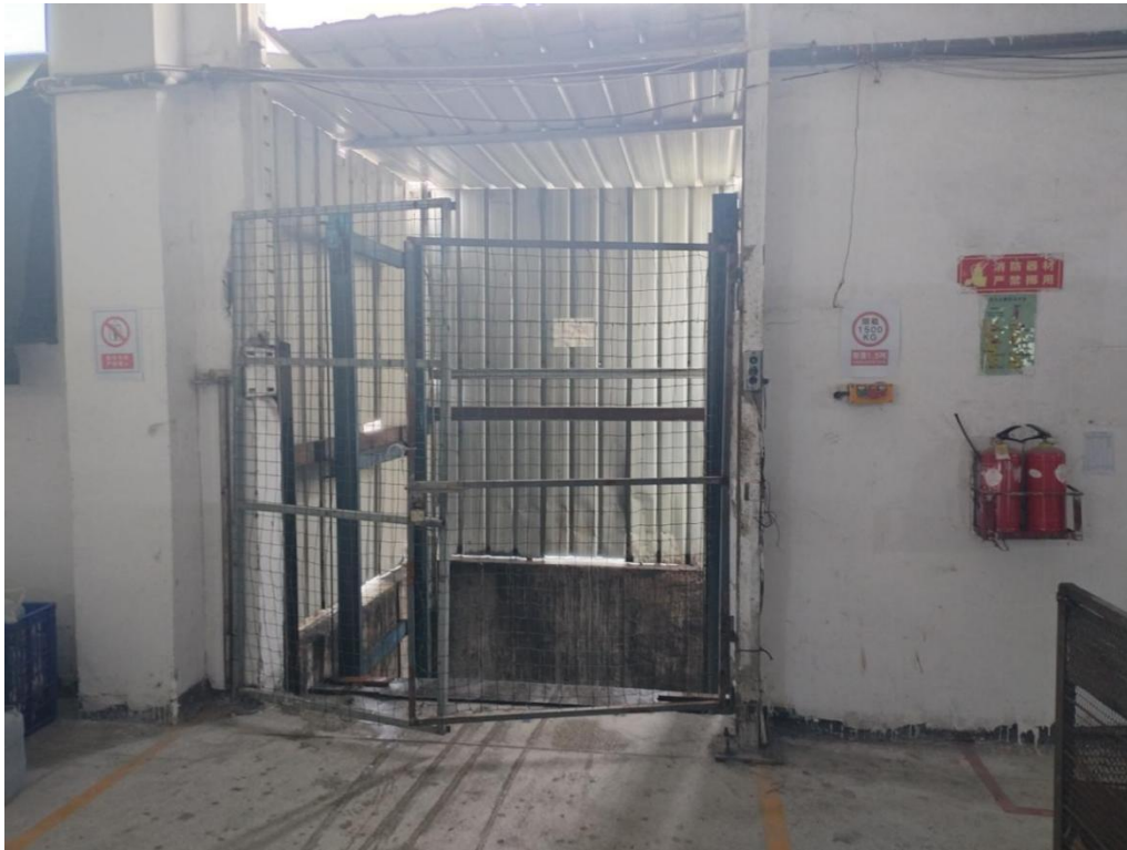
图2 2楼成型车间升降机井