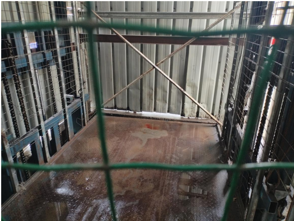
图3 升降机井1楼平台