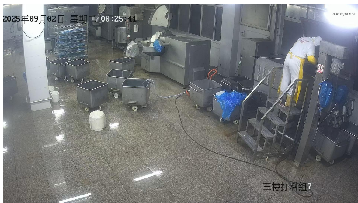
图1 事故现场监控截图

事故发生地点位于同安区轻工食品园美禾八路111号，源香食品公司三楼材料间搅拌机处，事发时为凌晨0时25分，车间照明情况正常。